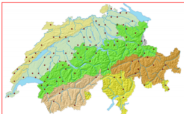
Figure 3: Répartition des 102 km 2 (points rouges) suisse sélectionnés pour la Liste Rouge. Les surfaces colorées, représentent les six régions biogéographiques de la Suisse: crème = Jura, turquoise = Plateau, vert = Versant Nord des Alpes, rose = Alpes centrales occidentales, orange = Alpes centrales orientales, jaune = Versant Sud des Alpes.

De ce set, 102 km 2 ont été sélectionnés de manière aléatoire, stratifiée selon les régions biogéographiques de Suisse. Ceux-ci seront inventoriés entre 2007 et 2010.