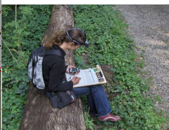
Figure 1: A gauche: exemple de parcours. A droite: observatrice en action.