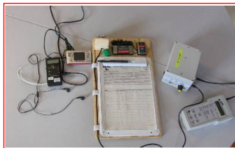
Figure 2: Équipement utilisé pour les relevés bioacoustiques. De gauche à droite: Détecteur D240x avec écouteurs et enregistreur numérique, sous-main avec microphone sensible aux ultrasons (vert), horloge, GPS et fiche de saisie, amplificateur et Bat-datalogger pour l'acquisition automatique.